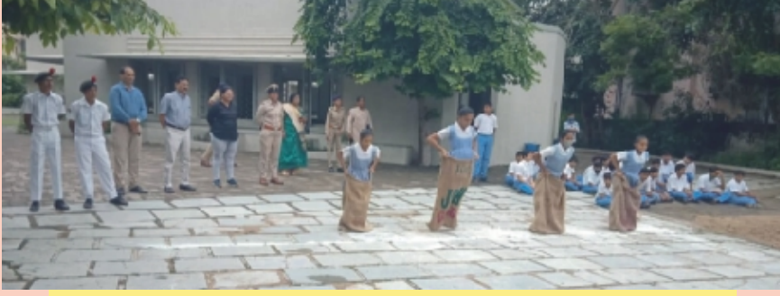
रमतोत्सवमां उत्साहमेर विद्यार्थीओ