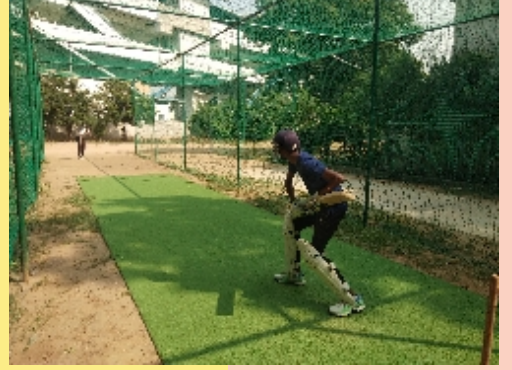
क्रिकेट प्रेक्टिस माटे नवी बे प्रकारनी पीय