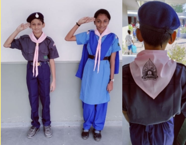
शिस्तबध्द स्काउट गाईड विद्यार्थीओ