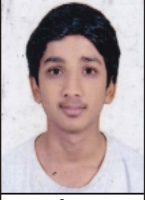
આર્ય આયુષ (૧૦-અ)

જીંદગી એમની એમજ વહી જાય છે. કલાકોના કલાકો મોબાઈલમાં સરી જાય છે. નથી રહ્યો સમય બાળકો પાસે ઢીંગલા રમવાનો હવે તો કેન્ડીકશમાં જ Teddy Bear રમાઈ જાય છે. નથી પ્રયત્ન કરાતા ૧૦ ડગલા ચાલવાને પાણી લેવા જાતે તોય ન જાણે કેમકરી Subway Sufar માં ૧૦ કિમી. દોડી જવાય છે. નથી કરાતી વાત માતાના ખોળાની ને પિતાના પ્રેમની ક્ષણભર હવે તો ફેસબુક પર જ LUVU MOM n DAD ના ફોટા મોકલાય છે. શાળામાં શાણપણને કલાસમાં કજીયા દેખાય છે, કારણ એટલું જ આ જે ભણતર પણ Online થતું જાય છે. ક્યાં રહ્યો છે સમય રૂબરૂ કોઈનો સંપર્ક કરવાનો હવે તો બસ whatsapp પર જ સંબંધ સચવાય છે. ભૂલી ગયા આજે લોકો માનવીની ભવાઈને દીકરી વ્હાલનો દરિયો હવે તો YouTube પર જ માણસાઈના દીવા ગવાય છે. જીંદગી એમની એમજ વહી જાય છે. કલાકોના કલાકો મોબાઈલમાં સરી જાય છે.