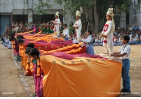
પૂજન માટે બાલરથીઓનું આગમન

તારીખ : ૩-૧૨-૨૦૧૯ના રોજ સંસ્થાના ૯૬મા સ્થાપનાદિનની ઉજવણી નવા શારદામંદિરમાં કરવામાં આવી.