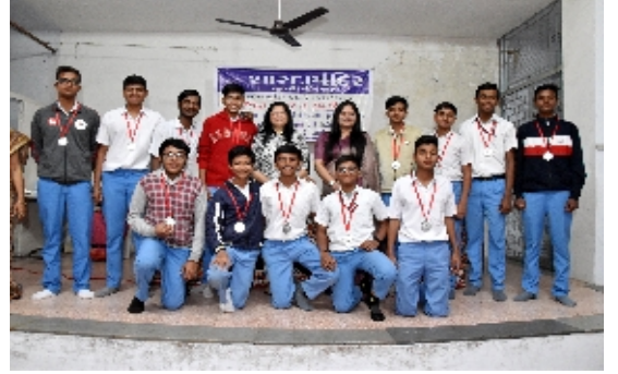
U-16 ક્રિકેટ ટીમ