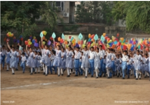
કૂચ કરતાં વિદ્યાર્થીઓ