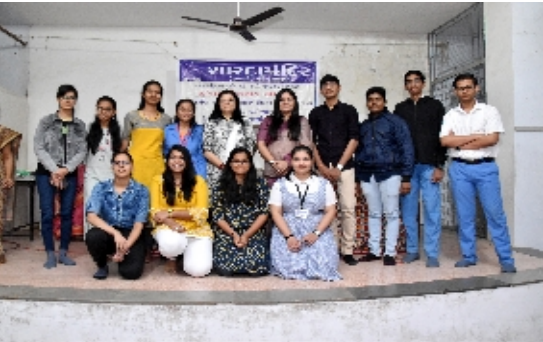
સંસ્થાના તેજસ્વી તારલાઓ