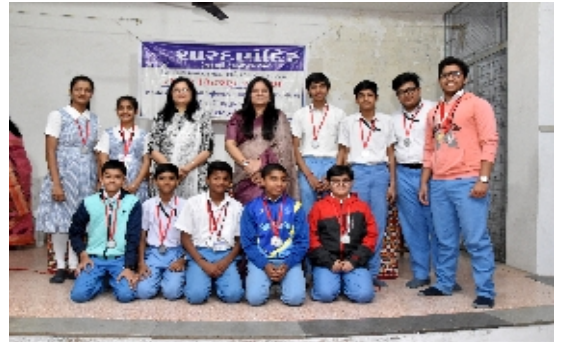
વિવિધ સ્પર્ધાઓના વિજેતાઓ