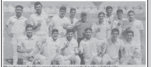
Shardamandir Vinaymandir team recorded a six-wicket win

શાળાની ક્રિકેટ ટીમને શાળા પરિવાર તથા સંસ્થા તરફથી ખૂબ ખૂબ અભિનંદન.