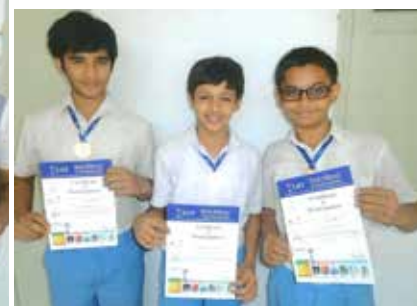
Winners of: NISO