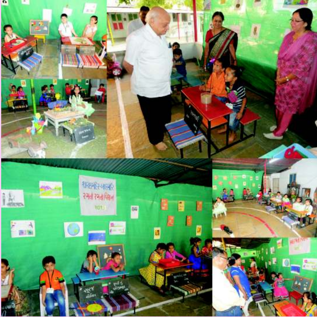
‘રમતાં રમતાં વિજ્ઞાન’ આલમંદિરમાં વિજ્ઞાનમેળો