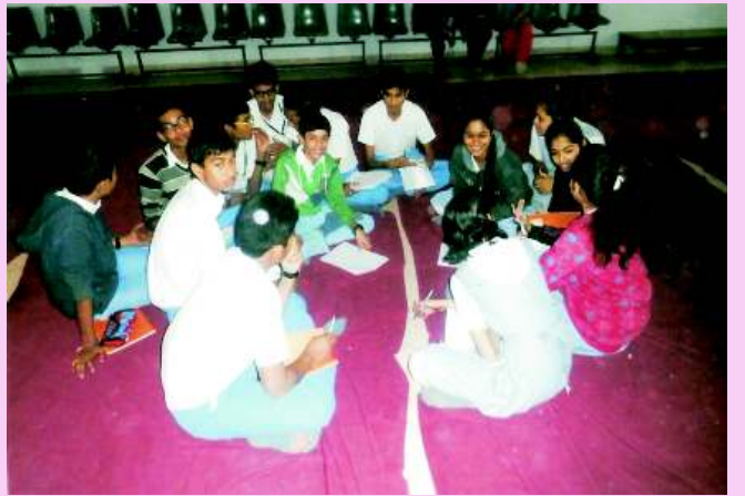
Let us think before we act: 'ખરીદી કરતા પહેલાં વિચાર કરવો' કાર્યક્રમ