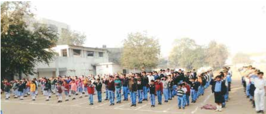
પ્રજ્ઞસત્તાક દિન ૨૬-૧-૧૬ દવજવંદન કાર્યક્રમ