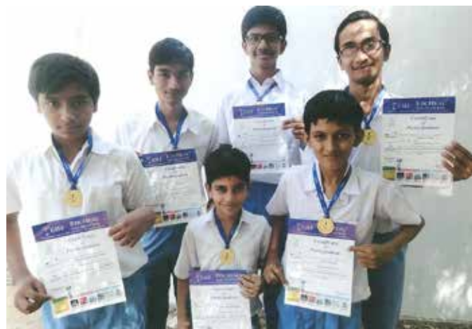
Winners of: NIMO

Edu Heal Foundation (EHF) is a registered NGO promoted by leading educationalists, corporate heads and media doyens. EHF conducts 8 olympiads annually for subjects English, Maths, Science, G.K. etc. 25 students of Shardamandir Modern School participated for Olympiads Level-1 (Nov-Dec) 2015.