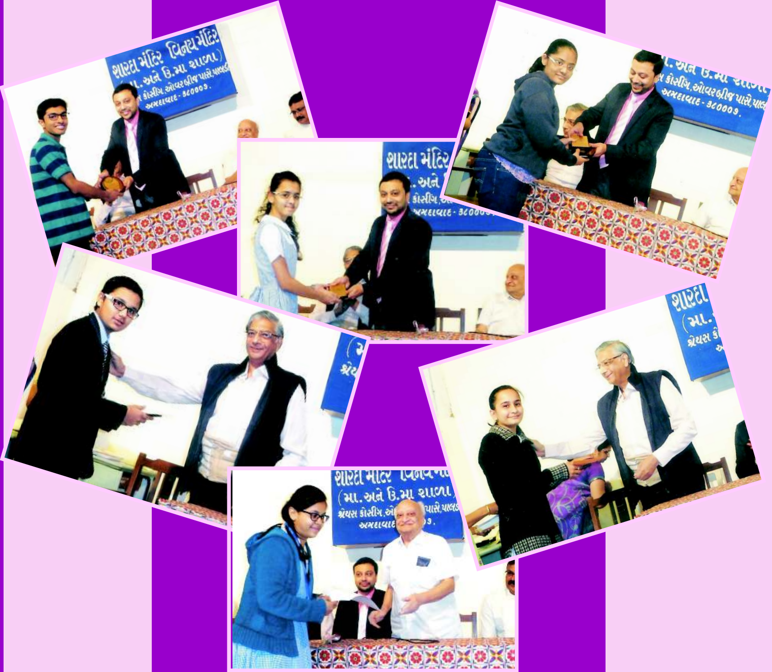
ઈનામ વિતરણ કાર્યક્રમ

વાર્ષિક અંક, માર્ચ, ૨૦૧૬ – વર્ષ ૩૪, અંક ૩