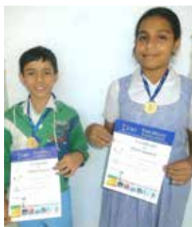
Winners of: IGO