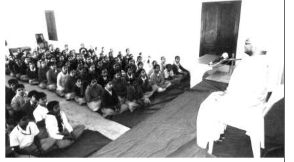
(શિશુમંદિર : એકાગ્રતા વિશે ચિંતન વ્યાખ્યાન)