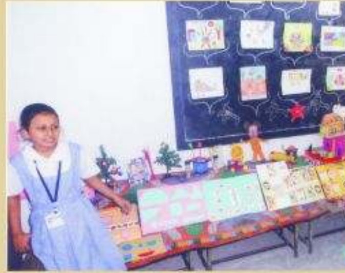
શિશુમંદિર પ્રોજેક્ટ પ્રદર્શન