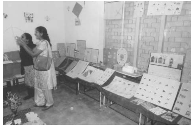
(શિશુમંદિરના વિદ્યાર્થી દ્વારા પ્રોજેક્ટ પ્રદર્શન)