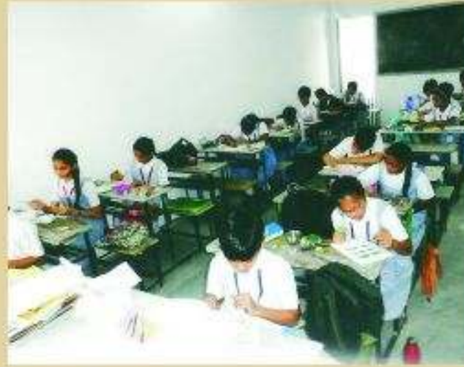
ડ્રોઇંગ ઇન્ટરમીડીયેટ - એલિમેન્ટ્રી ચિત્ર પરીક્ષા (તારીખ ૧૦, ૧૧, ૧૨)