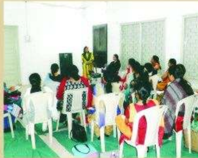
ટોરન્ટ દ્વારા શિક્ષકોને માર્ગદર્શન