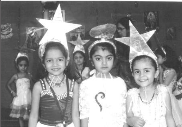
(બાલમંદિરના વિદ્યાર્થી દ્વારા નાતાલની ઉજવણી)