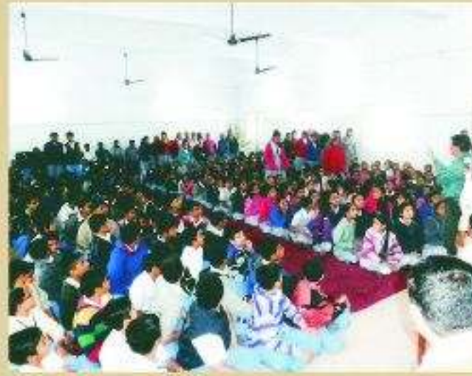
પોલિસ અધિકારી દ્વારા ટ્રાફિક અંગે સમજ વિશે કાર્યક્રમ