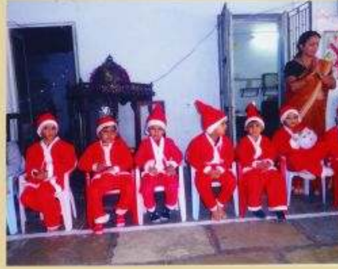
બાલમંદિરમાં બાળકો દ્વારા નાતાલની ઉજવણી