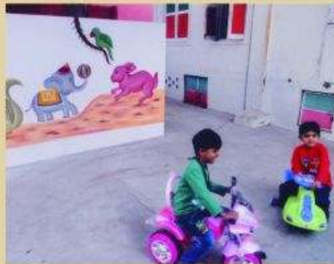
બાલમંદિરમાં સાયકલની મજા માણતા બાળકો