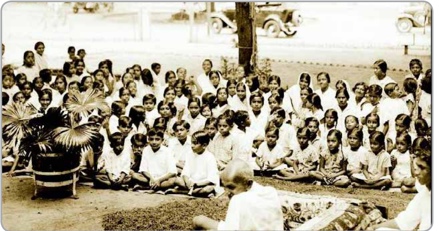
૨૯ જુલાઈ ૧૯૩૩, શ્રાવણ સુદ સાતમના રોજ, શારદામંદિરના દસમા સ્થાપનાદિને પૂ.બાપુએ બાળકોને સંબોધન કર્યું.