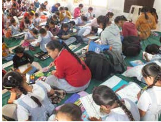
તા. ૩૦-૧-૧૫ના રોજ, ગાંધી નિર્વાણ દિન નિમિત્તે ચિત્ર સ્પર્ધાનું આયોજન થયું હતું.