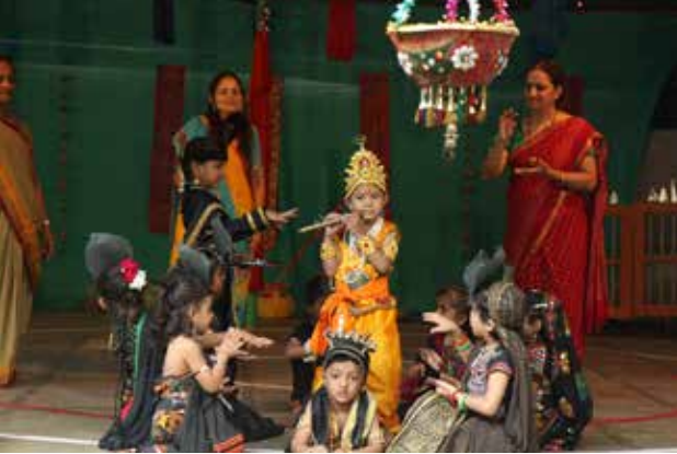
તા.૧૩-૮-૧૪ના રોજ જન્મશ્મી પર્વની ઉજવણી કરવામાં આવી. કંસદરબાર, કૃષ્ણજન્મ, મટકીકોડ, નાગદમન, રાસલીલા જેવા પ્રસંગોને વણી લઈ સુંદર કાર્યક્રમ કરવામાં આવ્યો, જેમાં બાળકોએ ઉચિત અભિવ્યક્તિ કરી.