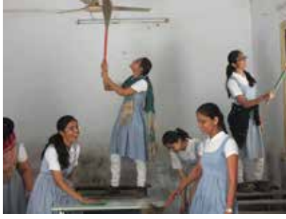
ઓક્ટોબર ૨૦૧૪ - શાળા સ્વચ્છતા અભિયાન