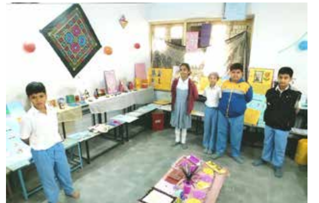
તા.૨૮-૧૧-૧૪ના રોજ યોજાયેલા વિજ્ઞાન મેળામાં વેસ્ટમાંથી બેસ્ટ - બનાવવાની પ્રવૃત્તિ કરવામાં આવી હતી.