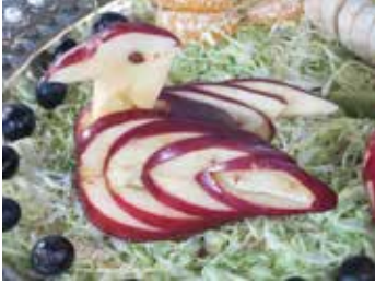
સલાડ ડેકોરેશન સ્પર્ધા, તા.૧૭-૧-૧૫