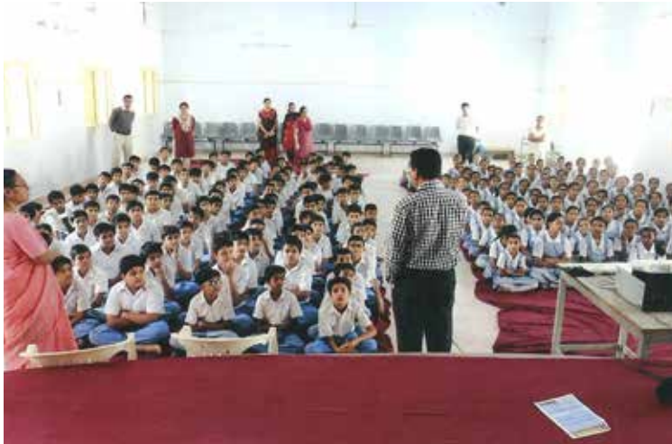
બાયસેગ કાર્યક્રમ: સરકાર દ્વારા પ્રસારિત કાર્યક્રમમાં પ્રાથમિક શાળાના ધો.૭-૮ ના વિદ્યાર્થીઓને પ્રાર્થનાખંડમાં, બીજગણિત વિષે માહિતી આપવામાં આવી રહી છે.