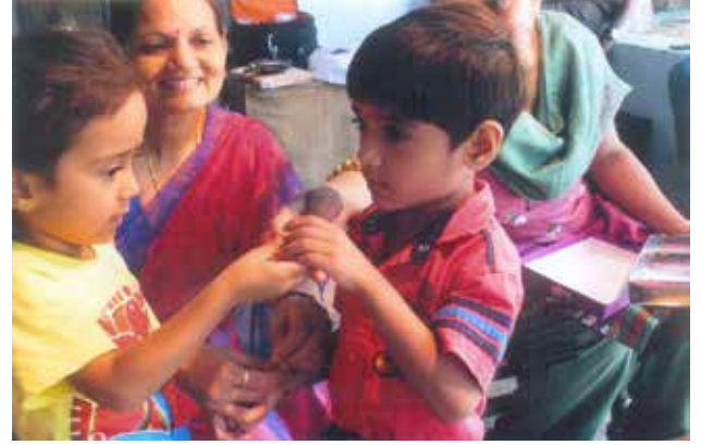
તા.૯-૮-૧૪ના રોજ, ભાઈબહેનના પવિત્ર તહેવાર રક્ષાબંધન પર્વની ઉજવણી કરવામાં આવી હતી. સમૂહ વાર્તા દ્વારા તહેવારની સમજ આપવામાં આવી અને બાળકોને તિલક કરી, મોં મીઠું કરીને રાખડી બાધવામાં આવી હતી.