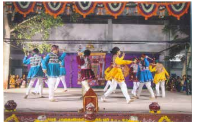
ગરબા મહોત્સવ ૨૦૧૪