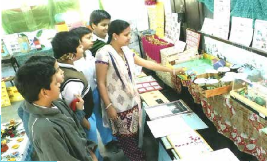
ભણતર સાથે ઘડતર