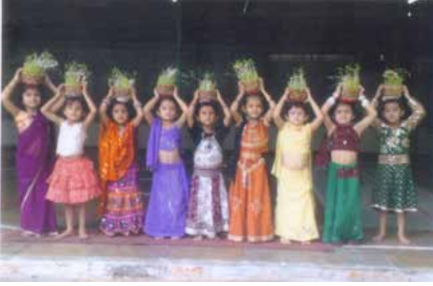
તા.૩-૭-૧૪ના રોજ ગૌરીવ્રત નિમિત્તે જ્વારાની વાવણી કરવામાં આવી.