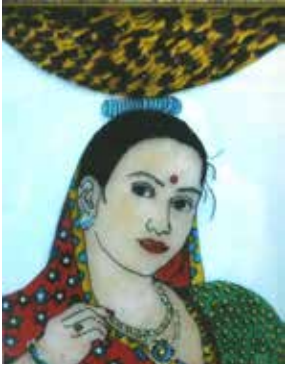
રંગોળી સ્પર્ધા, તા. ૧૭-૧૦-૧૪