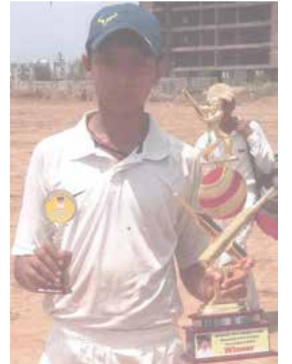
તા. ૧૪-૬-૧૪ના રોજ, રેલવે દ્વારા આયોજિત U-૧૪ ક્રિકેટ ટુર્નામેન્ટમાં શારદામંદિર સ્કૂલે ભવ્ય પ્રદર્શન કરી વીર શહીદ ભગતસિંહ કપ જીત્યો.